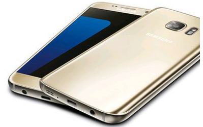
SAMSUNG Galaxy S7