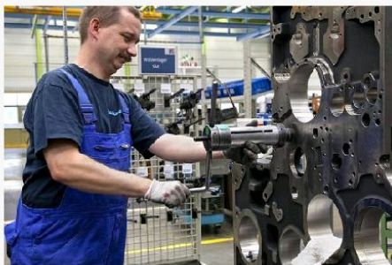
Lavoro - Sindacato Unitario.

Milano, 1 mar. (askanews) - Le imprese lombarde prevedono di rinnovare a scadenza i contratti a tutele crescenti in otto casi su dieci che però in sette casi su 10 sono risultati essere trasformazioni di contratti a tempo determinato. E' il dato che emerge da una ricerca condotta su un campione di 500 aziende di tutti i comparti dall'Osservatorio sul mercato del lavoro di Ancl Su Lombardia, Associazione Nazionale Consulenti del