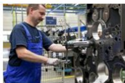
Ancl: 80% imprese lombarde pronte a confermare contratti Jobs Act

Milano, 1 mar. (askanews) - Le imprese lombarde prevedono di rinnovare a scadenza i contratti a tutele crescenti in otto casi su dieci che però in sette casi su 10 sono risultati essere trasformazioni di contratti a tempo determinato. E' il dato che emerge da una ricerca condotta su un campione di 500 aziende di tutti i comparti dall'Osservatorio sul mercato del lavoro di Ancl Su Lombardia , Associazione Nazionale Consulenti del Lavoro - Sindacato Unitario.