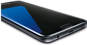
SAMSUNG Galaxy S7 edge